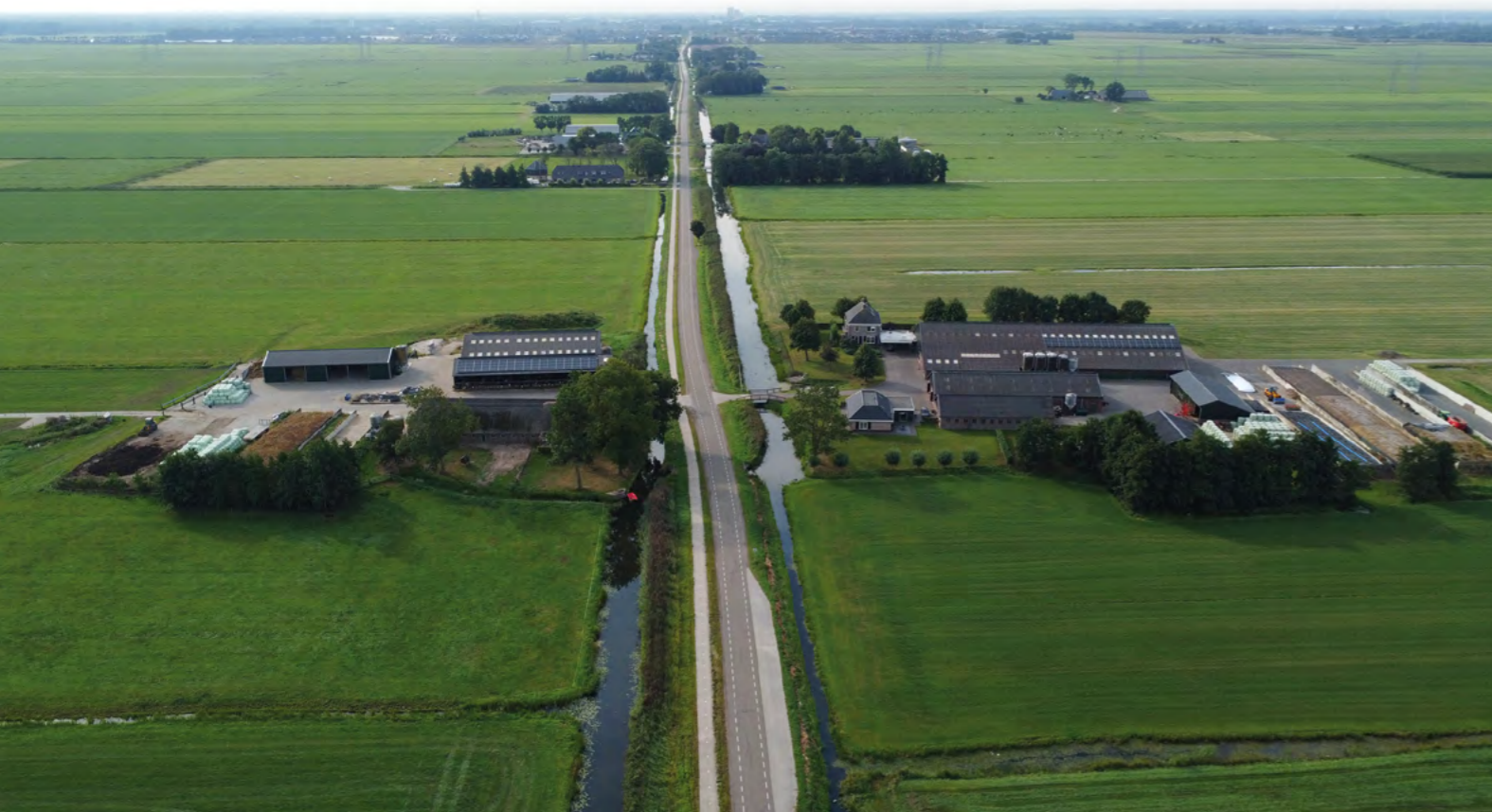
De Oude Wetering met het zicht op Zwolle.